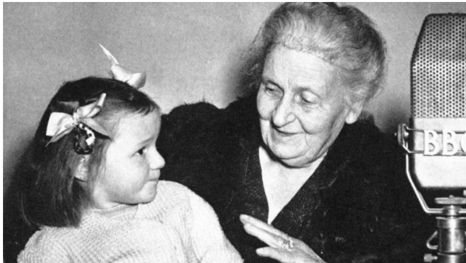
Slika 9. Marija Montessori s djevojčicom

dostojanstva, kojima dijete ostvaruje puninu ljudskosti. 33 Suprotno nekim mišljenjima, dijete je sposobno "uzvisiti se do nadosjetilnih pojmova" i osjetiti se "djetetom Božjim, s ljubavlju prihvaćenim u kući velikoga Oca Nebeskoga." 34