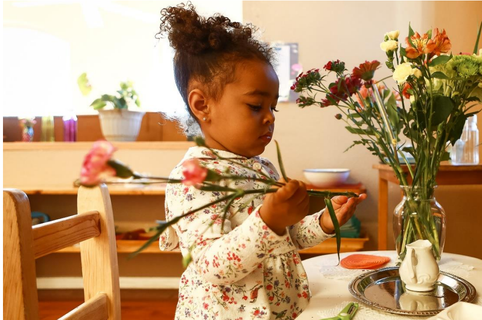
Slika 7. Razvoj pokreta i osjetila