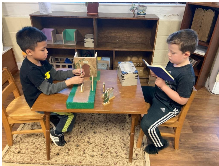
Slika 10. Molitva u atriju

Atrij predstavlja jedan od najvažnijih elemenata u obrazovanju koje pomaže djeci da prodube svoj odnos s Bogom. To je prostor koji omogućuje djetetu da slobodno istražuje i razvija unutarnji dijalog s Duhom Svetim, nakon što se predstavi neka tema ili lekcija. U tradicionalnim učionicama, odnosi su često usmjereni na interakciju između učitelja i učenika. Međutim, Marija Montessori je uočila da okruženje također igra ključnu ulogu u obrazovanju, često kao tihi, ali prisutni partner. Ona je tvrdila da okruženje ne treba biti samo pasivan element, već da može biti namjerno oblikovano kako bi postalo aktivan učitelj.