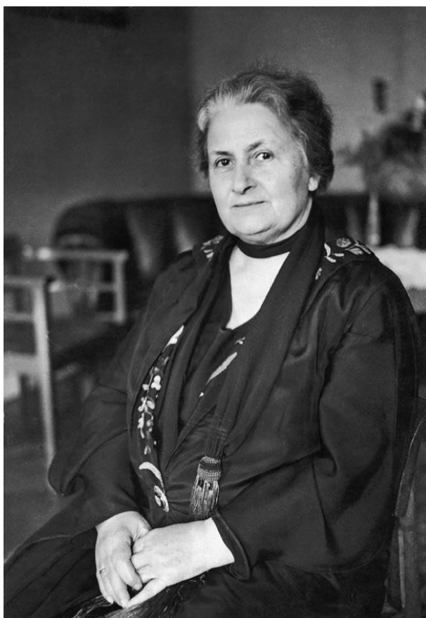
Slika 1. Marija Montessori

kroz pažljivo pripremljeno okruženje i taj koncept je nazvala auto-obrazovanjem. Naglašavala potrebu prilagođavanja obrazovnog procesa svakom djetetu: Jedini način da se prijeđe put za bolju obrazovnu praksu je početi s djetetom 3 . Njen uspjeh doveo ju je do osnivanja više „Dječjih kuća“ diljem cijele Italije i također je sve više počeo rasti interes za njezine obrazovne metode. Godine 1909. objavljuje svoju prvu knjigu, „ Metoda Montessori “, koja je postala bestseler i prevedena na razne jezike.