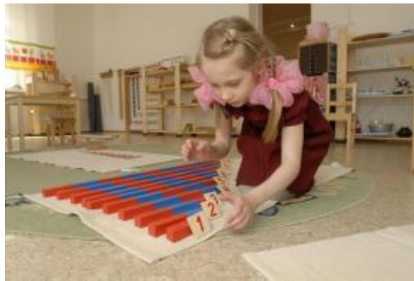
Slike 3.-6. Montessori materijali