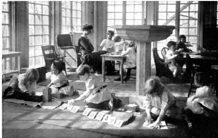
Slika 2. Dječja kuća Marije Montessori

Prvi Montessori vrtić otvoren je 6. siječnja 1907. godine u San Lorenzu u Rimu. Početak ovog vrtića bio je neobičan, ali pomalo i simboličan zbog njegove lokacije koja je bila u napuštenim zgradama koje su prethodno služile kao skloništa za beskućnike i kriminalce. U to vrijeme ove zgrade su simbolizirale siromaštvo i kriminal u Rimu. Marija Montessori kao već priznata liječnica i zagovornica higijenskih reformi suočila se s izazovom pružanja obrazovanja i skrbi djeci koje su živjele u iznimno teškim uvjetima.