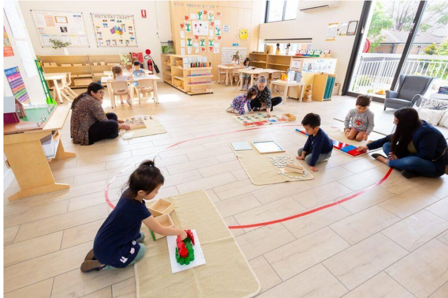
Slika 8. Montessori učionica