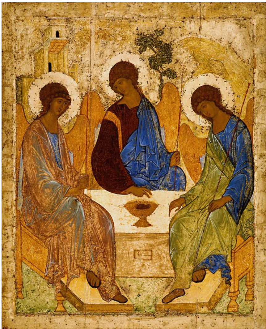
(Rubljov, Sveta Trojica, Tetjakov galerija, Moskva)