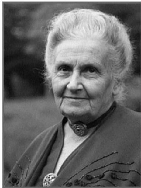
Slika 1. Maria Montessori