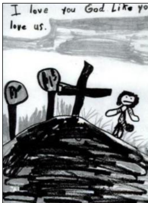
Slika 3. Erin, 7 godina. "Volim te Bože kao što ti voliš nas".