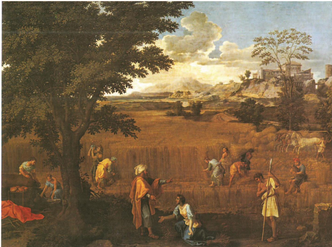
Slika Nicolasa Poussina - Ruta i Boaz, oko 1660, ulje na platnu, 118 x 160 cm, Pariz, Musee National du Louvre, usp. BIBLIJA U UMJETNOSTI , prijevod Truda Stamać, Založba Mladinska knjiga,, 1990., 86.