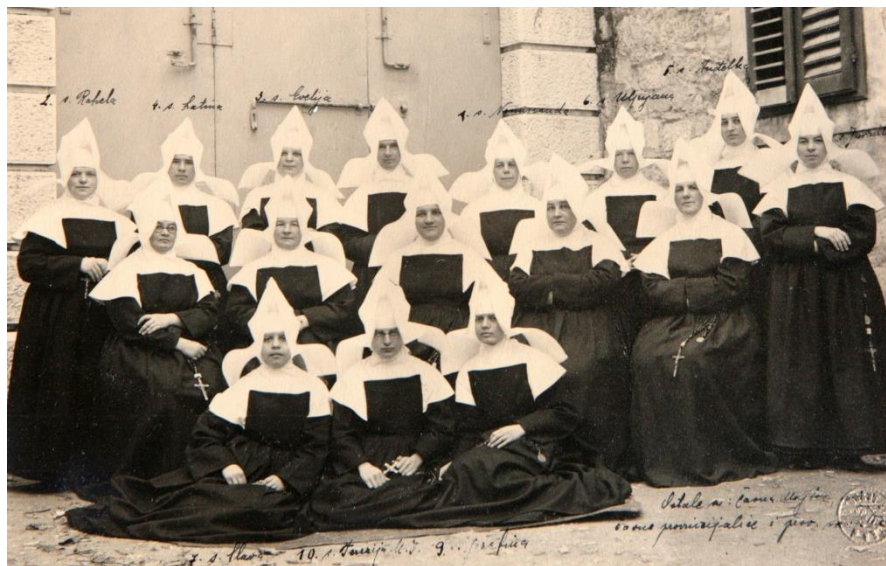
Slika 4: Druga skupina sestara koja je putovala u Argentinu 1934. ispred Provincijalne kuće u Splitu.