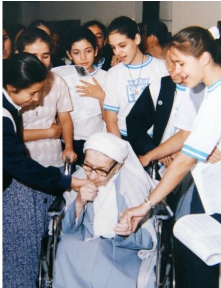
Slika 8: S. Slava s učenicama Zavoda

rastao i danas je to ustanova vrlo cijenjena u Asuncionu, s oko tisuću učenika. 81 Zacijelo, i s. Slava je tome pridonijela svojim radom u dječjem vrtiću. Jedna od profesorica koja je s njom radila ovako je napisala: „Poznavala sam jako dobro s. Slavu. Uvijek sam joj se divila i danas joj se divim zbog njezine velike djelotvorne ljubavi prema bližnjemu. Ona je zaista živjela za druge. Bila sam svjedokom nekih situacija koje smatram da su zaista bile čuda koja je postigla s. Slava snagom svoje velike vjere. Nismo imale novaca za siromahe. Ona bi rekla: 'Ne brini kćeri, već ćemo dobiti.' I zaista, pojavila bi se koja anonimna osoba i ostavila točno onu svotu koja je s. Slavi bila potrebna.“ 82