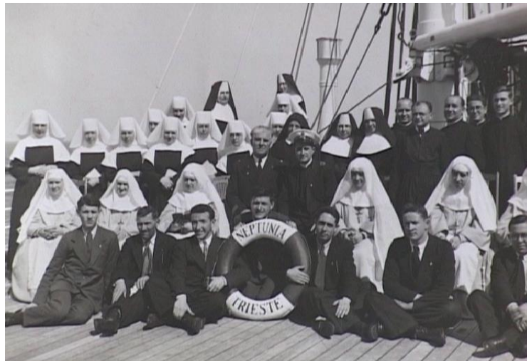
Slika 3: Prva skupina sestara koja je otplovila iz Splita prema Južnoj Americi brodom Neptunia 1934.

Vratimo se počecima misija. U zoru 12. srpnja 1934. brod „Neptunia“ je u splitskoj luci čekao na polazak, a sestre su jedva čekale da se otisne od kraja kako bi otplovile prema zemlji svojih čežnja – Argentini. 44 Kako je već navedeno, po dolasku u