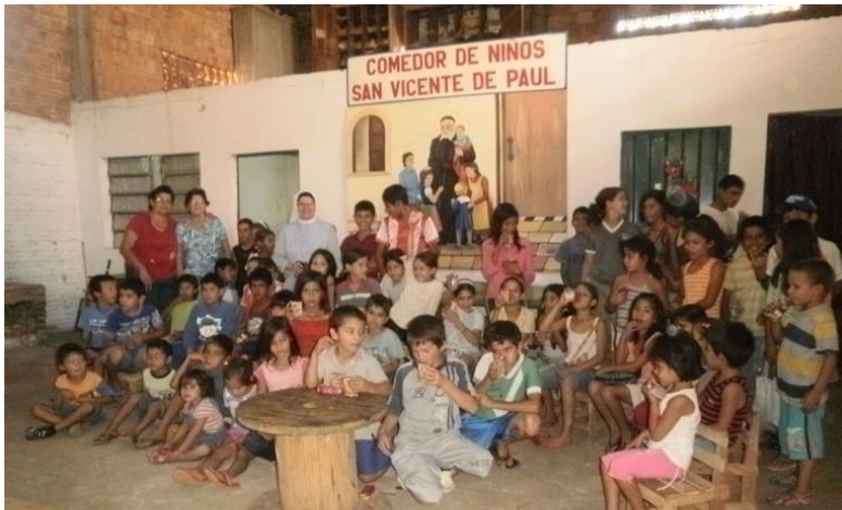
Slika 5: Sestre s djecom u školskom zavodu San Ignacio

Prvo mjesto njihova misijskog djelovanja bilo je San Ignacio, malo mjesto na jugoistoku Paragvaja, koje se razvilo od misijske postaje isusovačkih misionara. Isusovci su naime u 17. stoljeću razvijali posebne postaje kako bi zaštitili domorodce plemena Guarani od nasrtljivih i pohlepnih europskih osvajača. Zajednice u tim postajama postigle su veliki stupanj razvoja, suživota i demokracije. Bio je to plod velikih napora i ljubavi strpljivih misionara isusovaca, neumornih graditelja i revnih navjestitelja evanđelja, koji su bili duša i srce tih zajednica u kojima su se sklonili ljudi