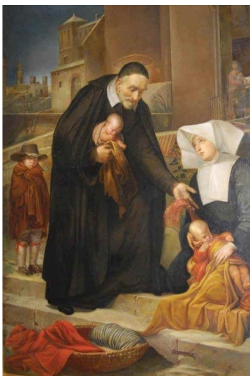
Slika 1: Sveti Vinko Paulski https://images.app.goo.gl/yaywaQ5JFzDE5FYF9

Ovih početnih nekoliko redaka iz pera sv. Vinka Paulskoga oporuka su sveca koji je imao neograničenu ljubav prema Bogu i toplu očinsku ljubav za svakoga čovjeka, napose za onoga koji je bio u nevolji. Bio je čovjek koji je znao prepoznati patnju i bol svojih suvremenika i nikada nije uzmicao kad im je trebala njegova pomoć. Sv. Vinko je dopustio da Bog po njemu djeluje i nastojao je da se po njemu i njegovim duhovnim sinovima i kćerima Božja ljubav prema siromasima i bolesnicima pokaže u svojoj punini. Kćerima kršćanske ljubavi znao je reći da katkada trebaju ostaviti Boga radi Boga, tj. prekinuti svoju molitvu da bi pomogle potrebnomu, u kojemu, isticao je, prebiva Bog. On sam u tome im je prednjačio. Njegov rad je proizlazio iz njegove povezanosti s Bogom, praktički on nikad nije napuštao Boga, jer ga je posvuda susretao u siromasima. Njegova duša molila je kada je siromahu davao