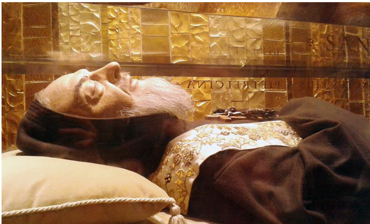
Neraspadnuto tijelo sv. Pija 52

Najveći plod njegove molitve, misticizma, života u katoličkoj duhovnosti, s posebnom privrženosti prema Gospinoj krunici, života u poniznosti, patnji za dobro drugih, ostaje zauvijek vidljiv na njegovu tijelu koje se, ni nakon 55 godina poslije njegove smrti, nije raspalo, a koje se čuva u crkvi sagrađenoj njemu u čast u San Giovanni Rotondu.