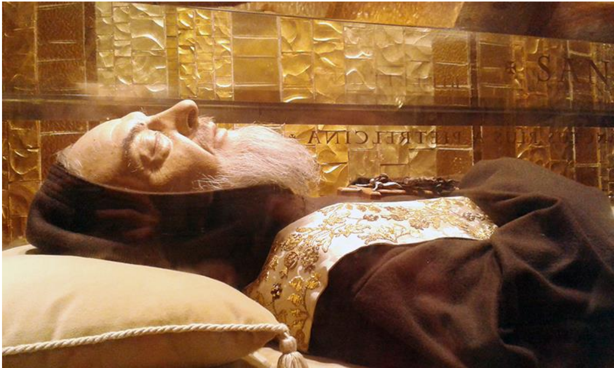
Neraspadnuto tijelo sv. Pija 52

Najveći plod njegove molitve, misticizma, života u katoličkoj duhovnosti, s posebnom privrženosti prema Gospinoj krunici, života u poniznosti, patnji za dobro drugih, ostaje zauvijek vidljiv na njegovu tijelu koje se, ni nakon 55 godina poslije njegove smrti, nije raspalo, a koje se čuva u crkvi sagrađenoj njemu u čast u San Giovanni Rotondu.