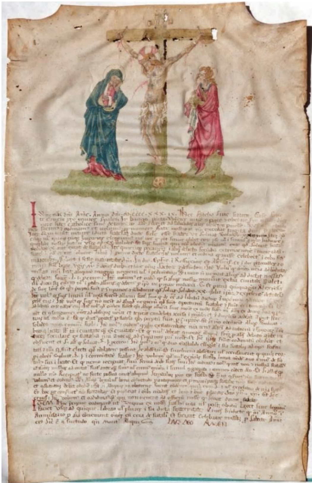
Slika 2. - Matrikula bratovštine iz 1439. godine