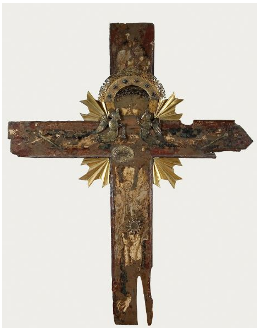
Slika 5. Prikaz sv. Križ u Velom Varošu

Tradicijska predaja o čudotvornom sv. križu čini glavnu okosnicu bratovštine i župe čije je ime preuzeto kao zaštitnik. Prema predajama bratovštine o štovanju Kristovog križa seže u same početke osnutka bratovština sv. Križa 1439. godine. Usmena predaja nam prenosi da je slikani križ uslijed nevremena nakon brodoloma dopluta do splitske obale, na područje Matejuške. 162