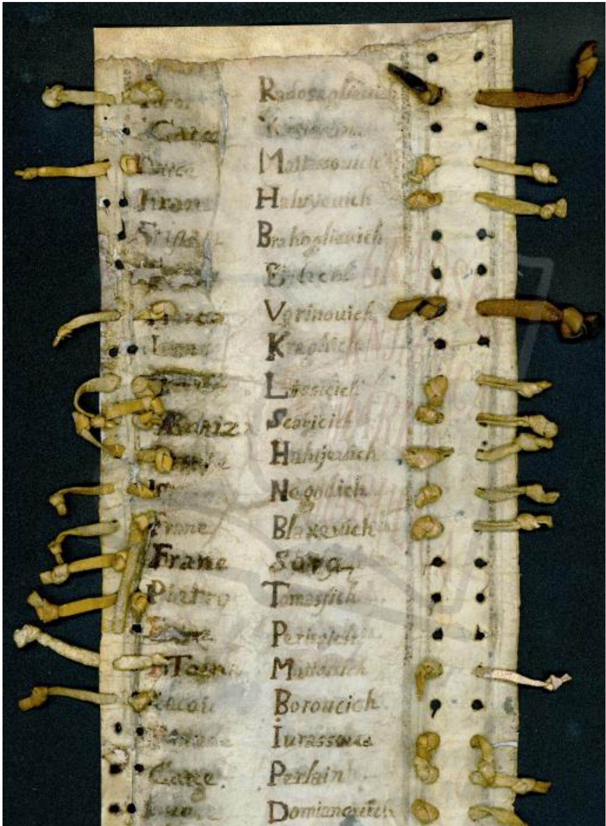
Slika 1. - Oputa ili Vaketa bratovštine sv. Križa iz arhiva Zavičajne zbirke Spalatina - GKMM Split