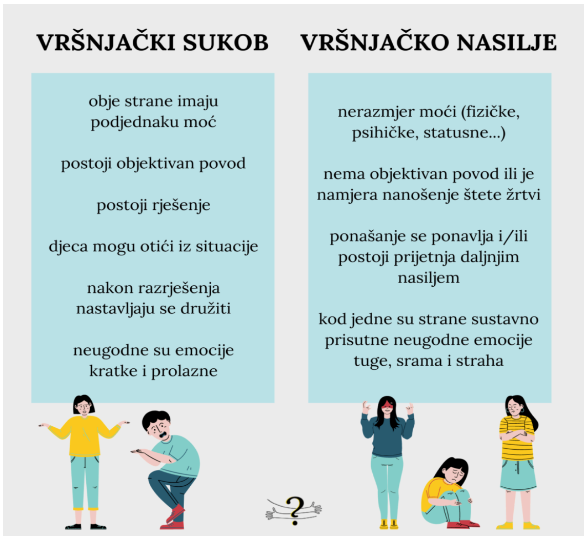
Slika 1. Razlika sukoba i nasilja

"Prema stručnoj literaturi, glavni akteri bullyinga su nasilnik (ili grupa nasilnika) i žrtva. Treba istaknuti kako literatura predlaže da upotrijebljena terminologija ima bolje ekvivalente u „djeca koje trpe nasilje“ i „djeca koja se nasilno ponašaju“. Iz odgojnih razloga, izrazi nasilnik i žrtva nisu prihvatljivi budući da „etiketiraju“ djecu koja su još u razvoju i ne potiču ih na promjenu ponašanja." 4