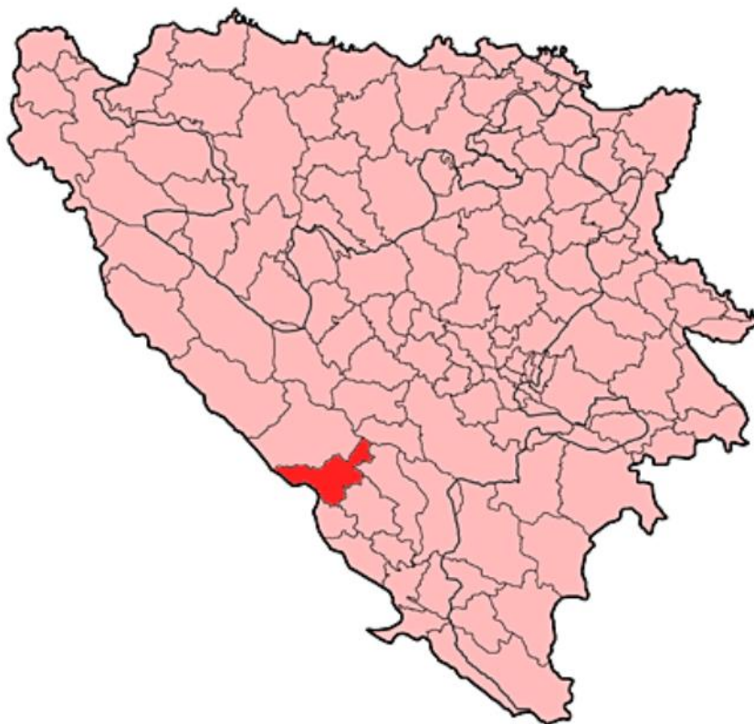
Geografski položaj općine Posušje 3

Općina Posušje prostire se u središnjem dijelu geografskog pojma zapadna Hercegovina uz granicu s Republikom Hrvatskom. Općina Posušje na jugu graniči s općinama Imotski i Grude, jugoistočno s općinom Široki Brijeg, a na sjeveru i sjeveroistoku s općinama Tomislavgrad i Jablanica 2 . Na slici 1 prikazan je geografski položaj općine Posušje na karti Bosne i Hercegovine.