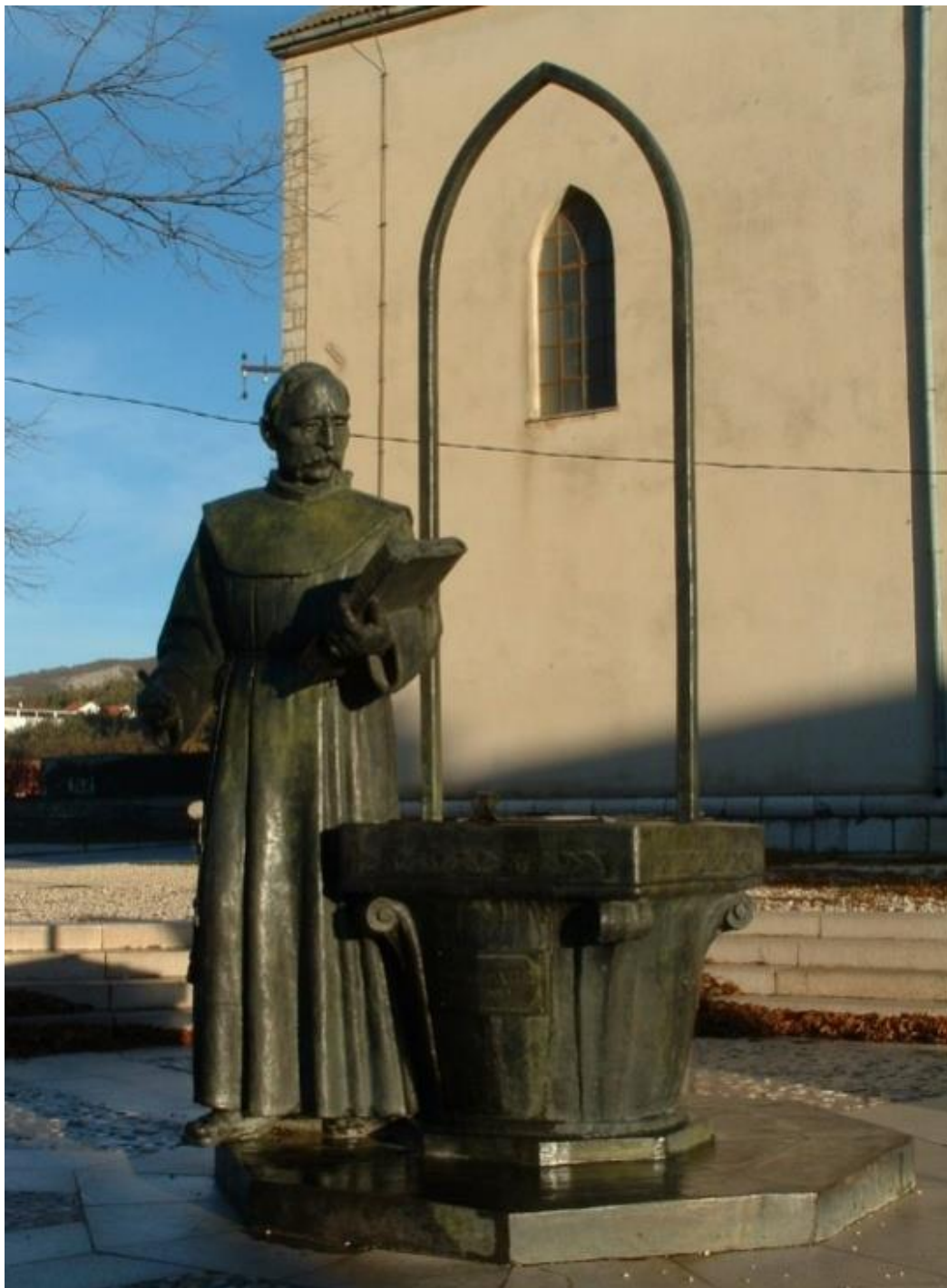
Brončani spomenik fra Grge Martića pred župnom crkvom u Posušju