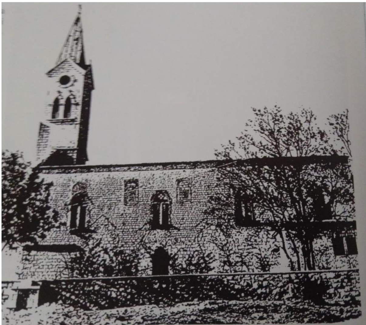
Župna crkva u Posušju tijekom obnove 1963. – 1966. 18

U srpnju 1970. vrh zvonika je prekriven bakrom. Svi poslovi su završeni za dva mjeseca, a 1972. crkva je iznutra obložena i plastikom, koja je tu stajala do skora kada je 2016.god tadašnji župnik fra Milan krenuo u adaptaciju „stare crkve“ – kako je danas posušani zovu. 1984. postavljen je u nišu na zvoniku veliki brončani Gospin kip. Kip je izradio akad. Kipar Petar Barišić. U razdoblju do sredine 1990.-tih, zbog komunističke vlasti, razvoj posuške crkve tekao je usporeno i uglavnom je stagnirao. Na slici 3 prikazana je posuška crkva 1997. U najnovije vrijeme u tijeku je restauracija crkve kojoj bi, prema želji župnika fra Milana Lončara