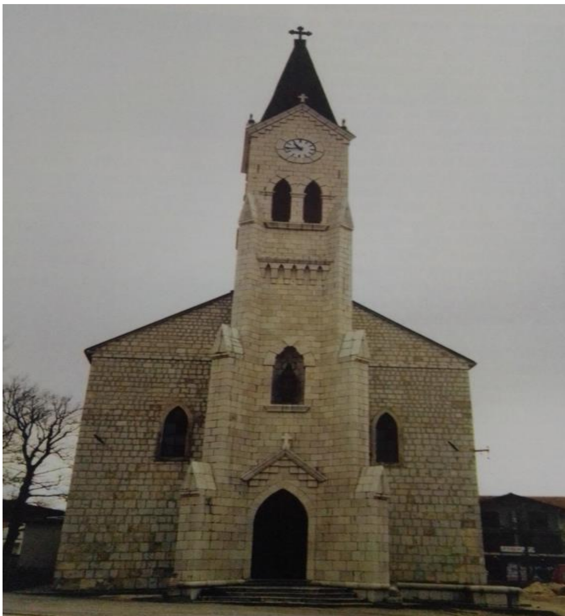
Župna crkva u Posušju 1996. 20

i arhitekata, trebalo vratiti izvorni izgled kako bi svojom kamenom ljepotom opet bila ures Posušja, kao nekada. 19