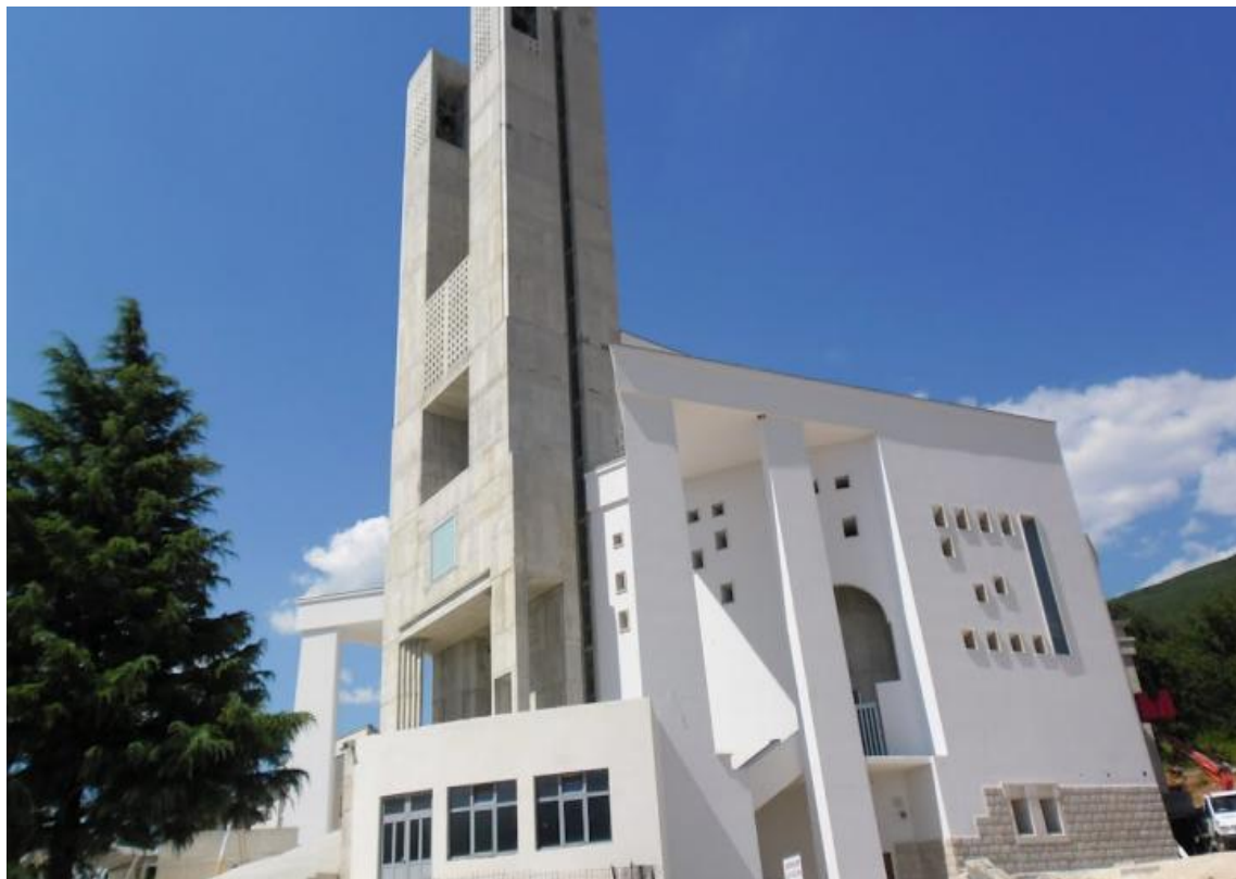
Crkva Blažene Djevice Marije Posušje – nova gradnja (slika iz 2012. godine)

stajanjem oko 1500, a s popratnim prostorijama primi i više od 2500 vjernika. U crkvi je postavljeno osam velikih i 58 malih vitraja. 21