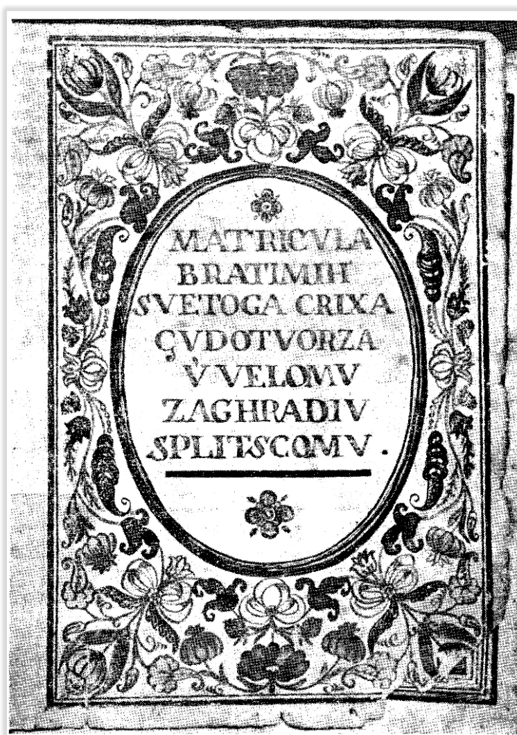
Slika 3. Matrikula bratovštine sv. Križa iz 1709. godine [fotografija N. Bezić-Božanić iz rada 'Četiri pravilnika bratovštine iz splitskog Velog Varoša' iz 1984. god.]

Navedena matrikula sadržava svojevrsnu preambulu u kojoj je naveden naziv bratovštine, mjesto i godina osnivanja. U daljnjem tekstu nalazimo 28. članaka ili kapitula u kojima su navedena glavna pravila bratovštine. 112 Navedeni dokument je tada vjerojatno imao i prijevod na hrvatskih jezik, međutim posjedujemo prijevod iz 17. stoljeća koji je napisan u duhu starohrvatskog pučkog govora i starog nereformiranoga pravopisa. 113