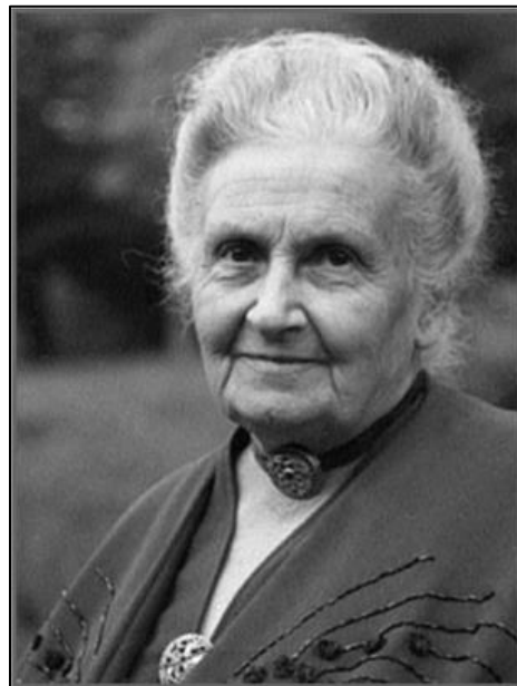
Slika 1. Maria Montessori