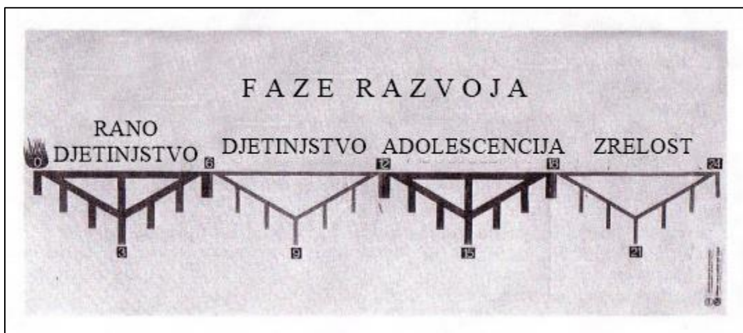
Slika 2. Faze razvoja djeteta