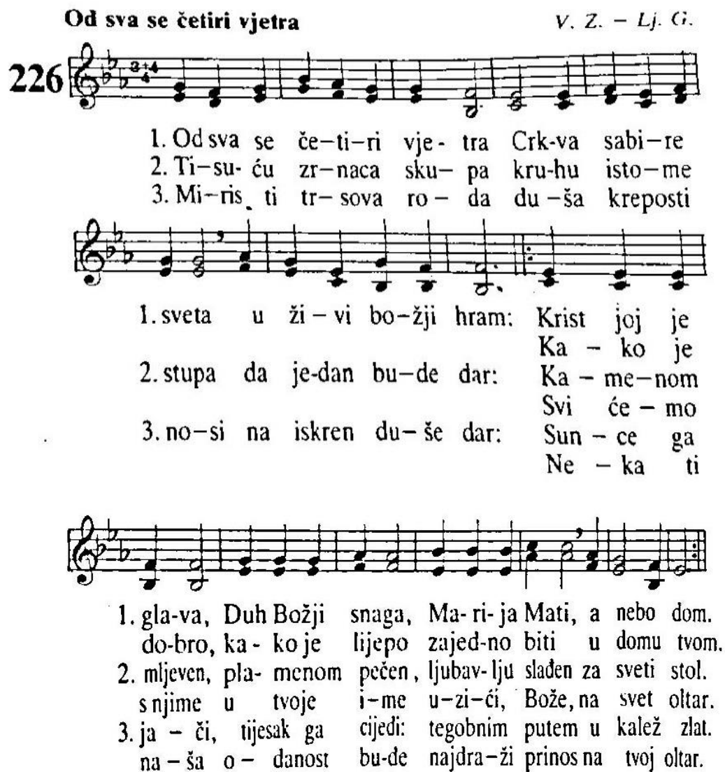
Slika 1. Notni zapis za popjevku Od sva se četiri vjetra 51