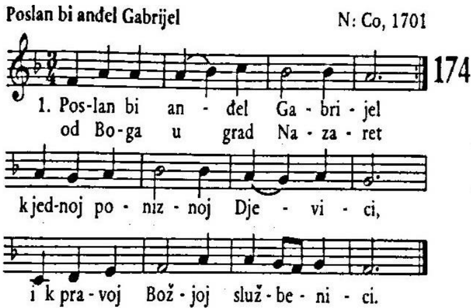
Slika 2. Notni zapis za pjesmu Poslan bi anđel Gabrijel 57